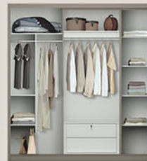
Terbuat dari particleboard dan MDF finishing PVC sheet colt beige kombinasi pastel grey dengan penambahan cermin