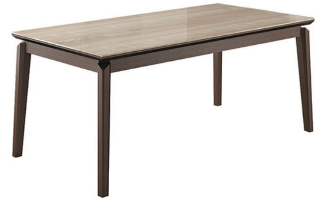
DT 343 meja makan

Meja terbuat dari bahan kayu solid finishing PU walnut Finishing kaca meja dilapisi pvc sheet natural