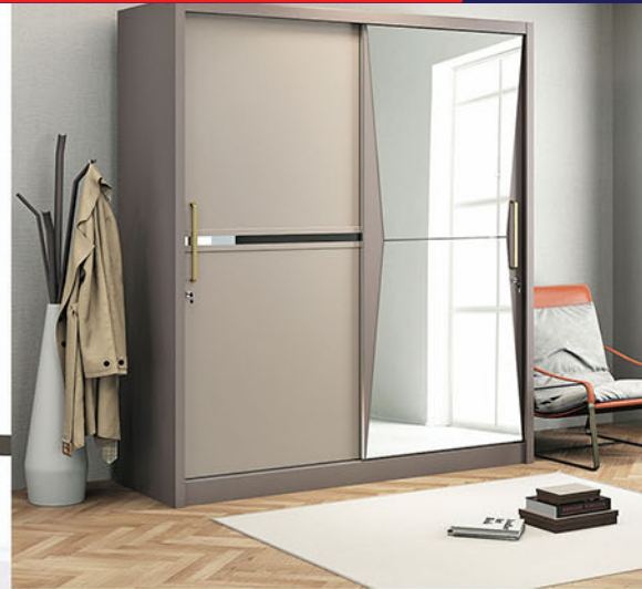
LP VOLARE 4D SL lemari pakaian Pintu sliding