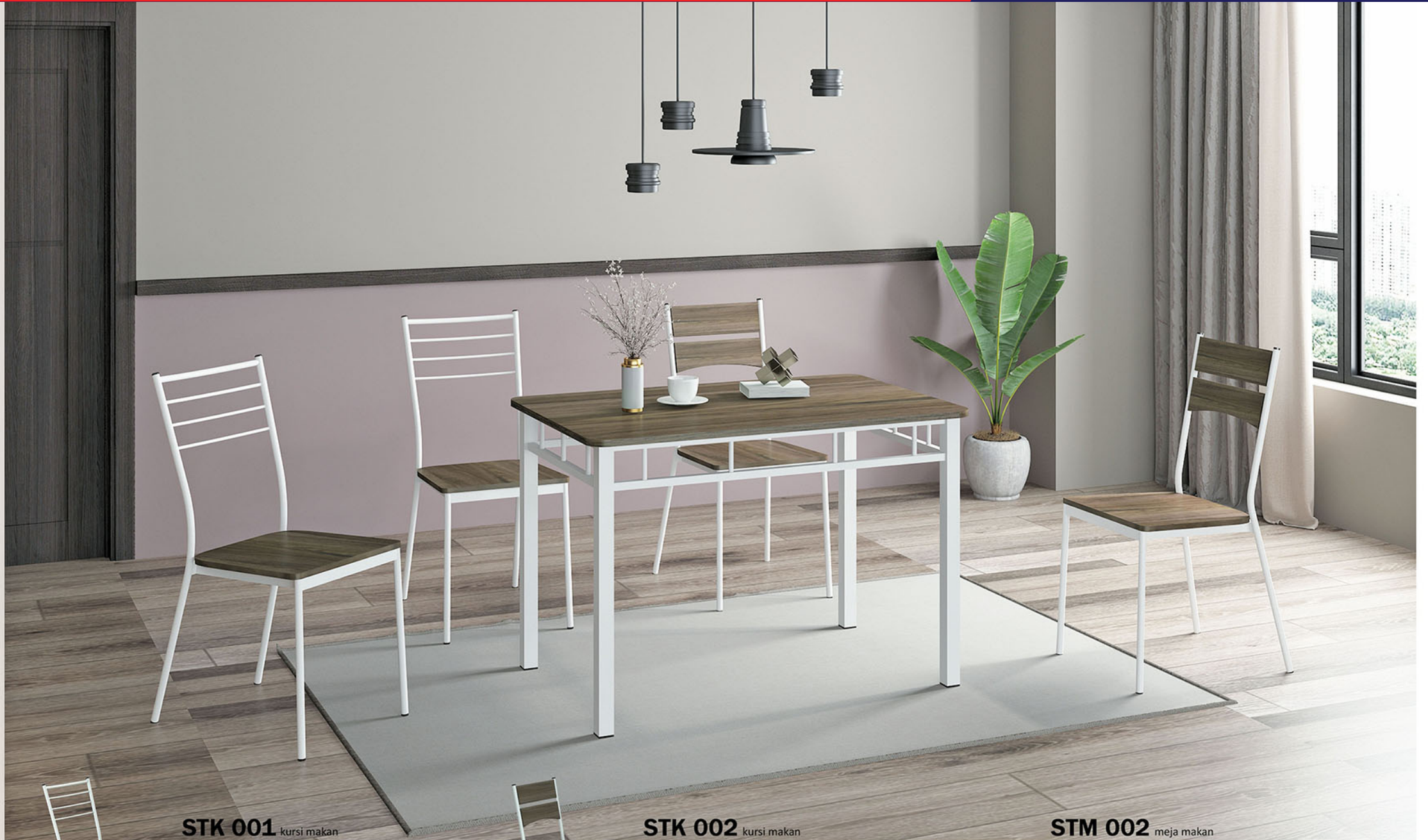
STK 001 kursi makan

Rangka kursi terbuat dari pipa besi finishing powder coating putih Dudukan kursi MDF finishing pvc sheet grasse grey oak