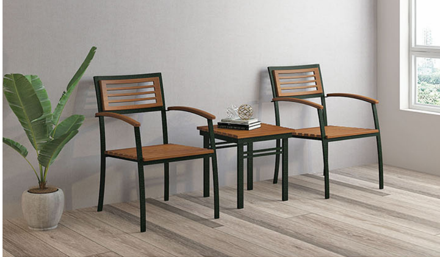
KT 001 kursi teras MT 001 meja teras P.50 X L.50 X T.45

Rangka pipa besi finishing powder coating antique green