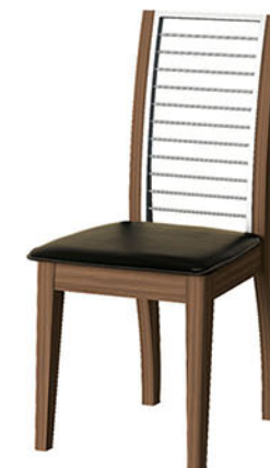
DC FUJIYAMA kursi makan

Kursi terbuat dari bahan kayu solid finishing PU cocoa brown Dengan penambahan kombinasi sandaran dari pipa besi yang di chrome Jok kursi dari spons dilapisi oscar