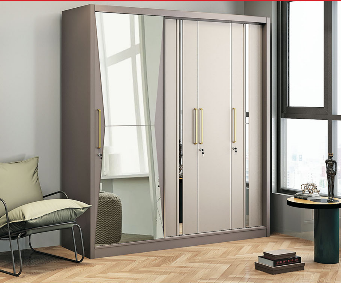
LP VOLARE 4D SS lemari pakaian Pintu sliding dan swing P.200 X L.60 X T.220