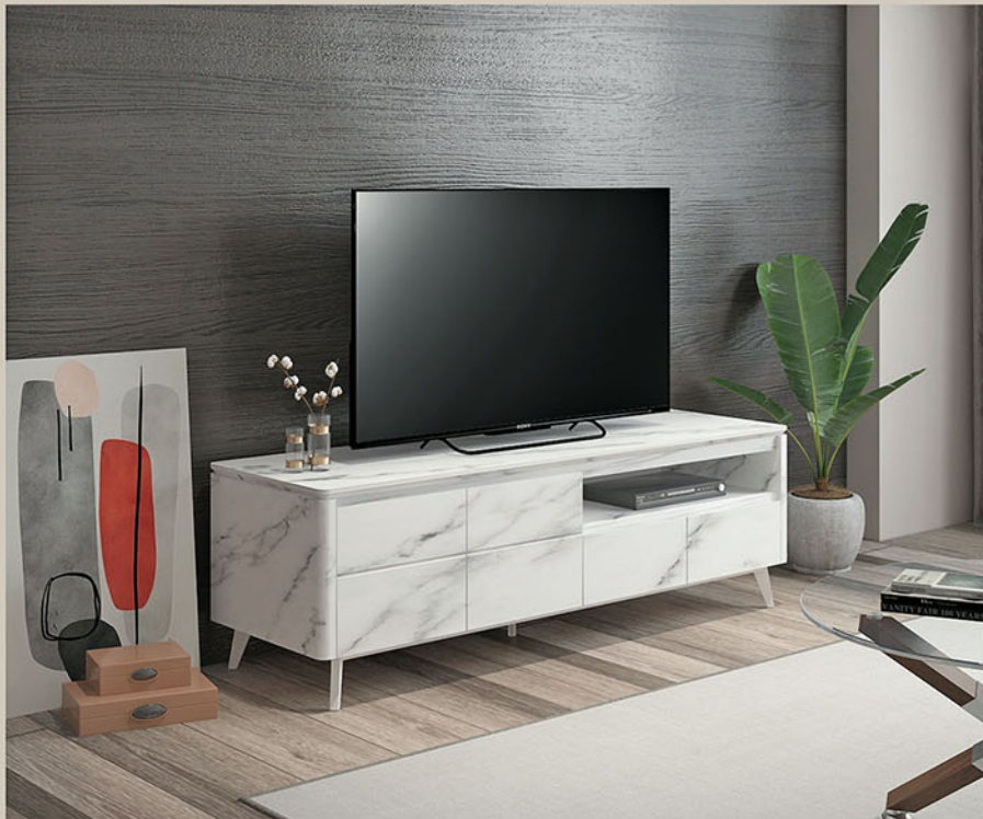
TC MARBLE 160-02 tv cabinet P.160 X L.50 X T.50

Terbuat dari particleboard dan MDF Finishing pvc vacum marble Terdapat 1 laci & 2 pintu Variasi rak terbuka Kaki terbuat dari pipa besi finishing powder coating putih