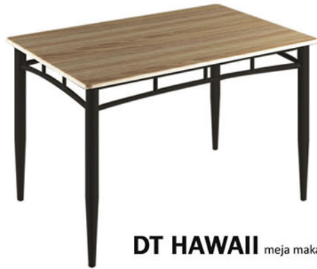
DT HAWAII meja makan

Rangka Meja terbuat dari pipa besi pilihan finishing powder coating putih & powder coating hitam Top meja menggunakan MDF finishing PVC sheet warna natural