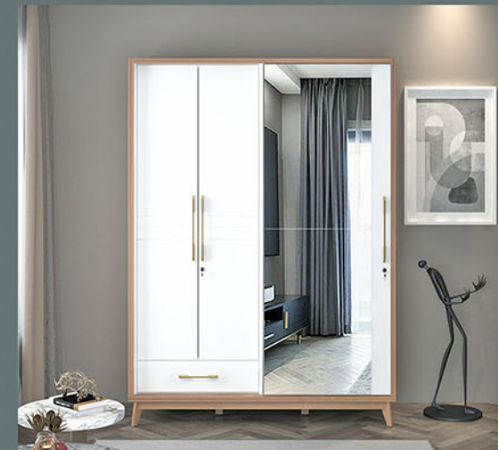
Terbuat dari particleboard dan MDF finishing pvc vacuum warna natural yang dikombinasikan dengan pvc vacuum putih dengan penambahan cermin Kaki terbuat dari kayu solid finishing fancy duco