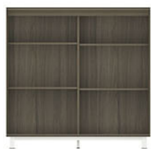
OR 008 P.120 L.40 T.120