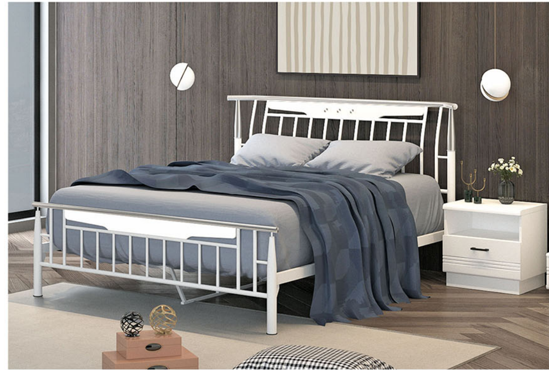
Bed BERLY tempat tidur Terbuat dari pipa besi bulat finishing powder coating putih (terdapat pilihan warna hitam) Dengan penambahan variasi MDF finishing paper sheet putih Serta accessories aluminium dan pipa besi di chrome