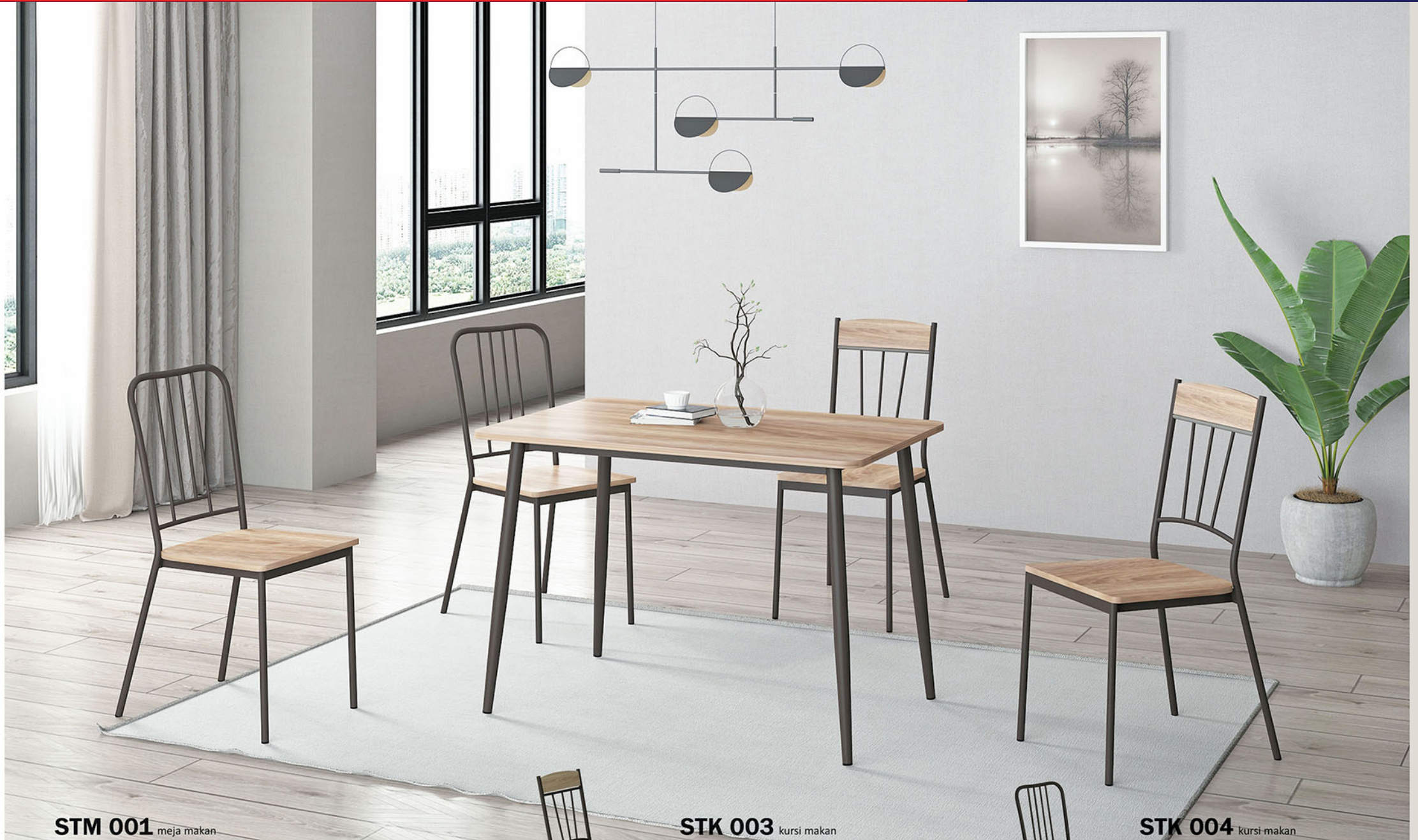
STM 001 meja makan

Rangka Meja terbuat dari pipa besi finishing powder coating brown matt Top meja MDF finishing pvc sheet natural