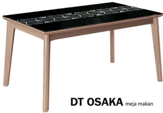
DT OSAKA meja makan

Meja terbuat dari bahan kayu solid dan kaki meja dari MDF finishing pvc sheet natural Finishing kaca meja dengan variasi sablon gambar yang dicat warna hitam pada seluruh permukaan kaca.