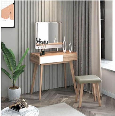
MR CARIBIA meja rias Terbuat dari particleboard dan MDF finishing pvc sheet natural dengan variasi pvc sheet putih Kaki terbuat dari kayu solid finishing fancy duco Terdapat dua laci