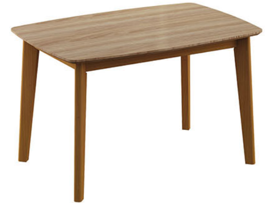
DT HONOLULU meja makan

Rangka Meja terbuat dari kayu solid finishing PU teak brown Top meja menggunakan MDF finishing PVC sheet natural