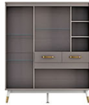
CB VOLARE 120-01 cabinet P.120 X L.40 X T.144