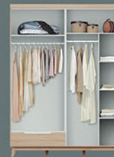
lemari pakaian Pintu swing P.160 X L.60 X T.220