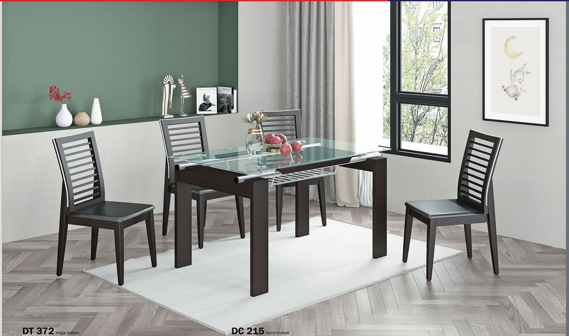
DT 372 meja makan

Meja terbuat dari kayu solid finishing PU walnut Rak meja terbuat dari pipa besi yang di chrome Top meja menggunakan kaca polos