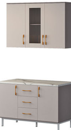
KC 02 A-3 P.120 X L.35 X T.80