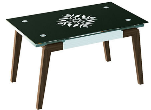
DT FUJIYAMA meja makan

Meja terbuat dari bahan kayu solid finishing PU cocoa brown Dengan penambahan variasi dari MDF finishing paper sheet putih Finishing kaca dengan variasi sablon gambar yang dicat hitam pada seluruh permukaan