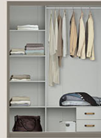
LP VOLARE 3D SS lemari pakaian Pintu sliding & swing P.160 X L.60 X T.220

Terbuat dari particleboard dan MDF finishing PVC sheet colt beige kombinasi pastel grey dengan penambahan cermin terdapat laci tersembunyi