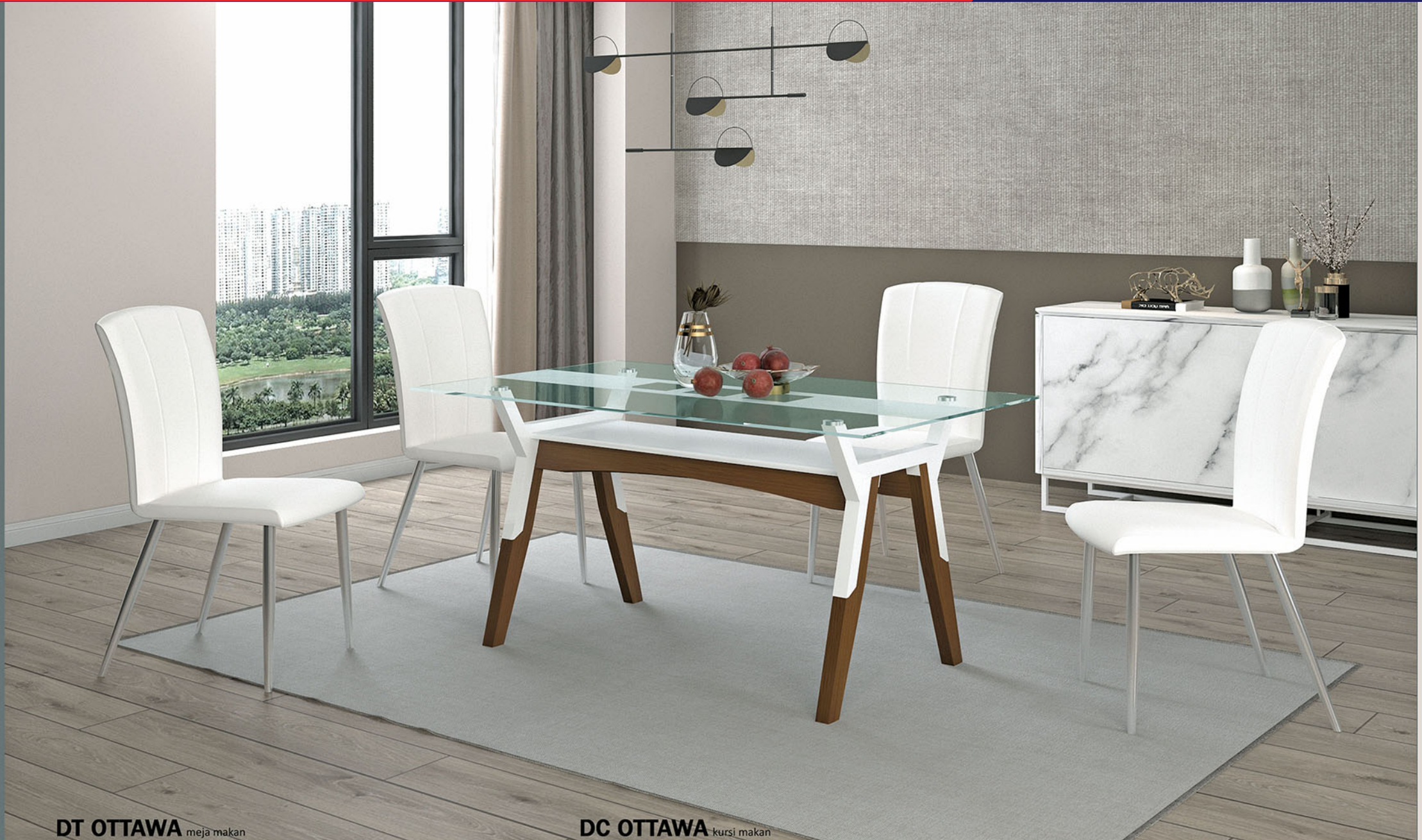
DT OTTAWA meja makan

Rangka Meja terbuat dari bahan kayu solid finishing PU teak brown Dengan penambahan variasi dari besi finishing powder coating putih Variasi rak MDF finishing pvc sheet putih glossy Finishing kaca dengan variasi sandblast