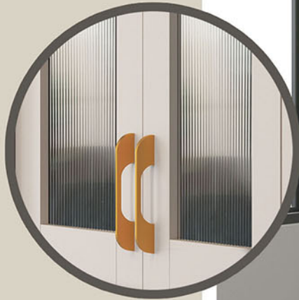
fluted glass/motif garis