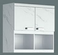
KC 01 A-1 P.80 X L.35 X T.80

KITCHEN CABINET 01 P.120 X L.48 X T.201,5 MDF kombinasi kayu solid Panel finishing pvc sheet natural & putih Kayu solid finishing fancy duco