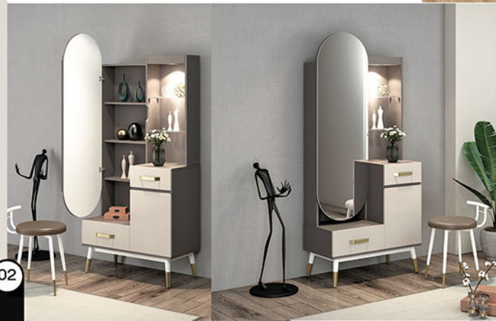
DR VOLARE dresser Terbuat dari particleboard dan MDF finishing PVC sheet colt beige kombinasi pastel grey Variasi kaki besi coating emas Terdapat 2 laci & 1 pintu Terdapat beberapa rak dibelakang cermin pintu cermin bisa dibuka dan ditutup