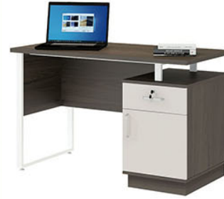
OT 156 P.120 X L.60 X T.75

Terbuat dari Particleboard dan MDF finishing pvc sheet Natural kombinasi pvc vacum Colt Beige. Variasi Kaki meja pipa besi finishing powder coating Putih. Body pedestal terdapat 2 laci