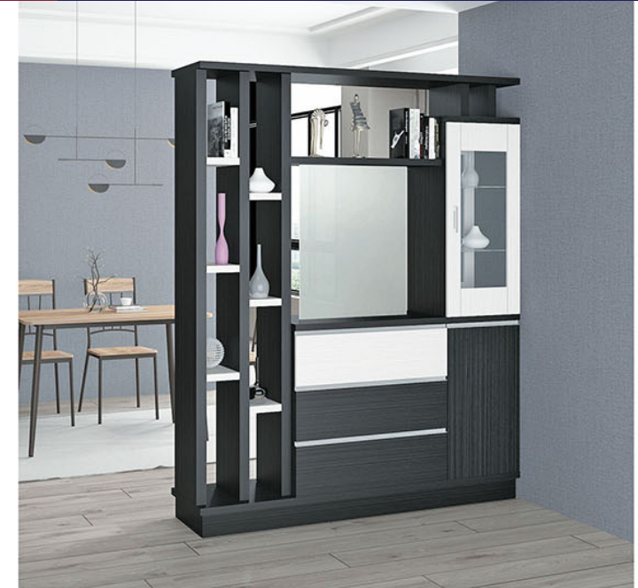
DV 002 P.160 X L.40 X T.200

Terbuat dari particleboard dan MDF finishing paper sheet walnut dan putih dikombinasikan pipa besi finishing powder coating putih dan pipa besi chrome Terdapat 4 pintu, 2 laci dan beberapa rak