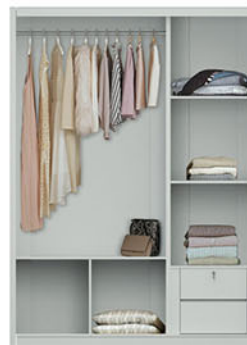
LP MARBLE 3D SL [sliding] W.160 X D.60 X H.220 pvc sheet marble (+ mirror)