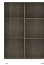
OR 010 P.80 L.40 T.120