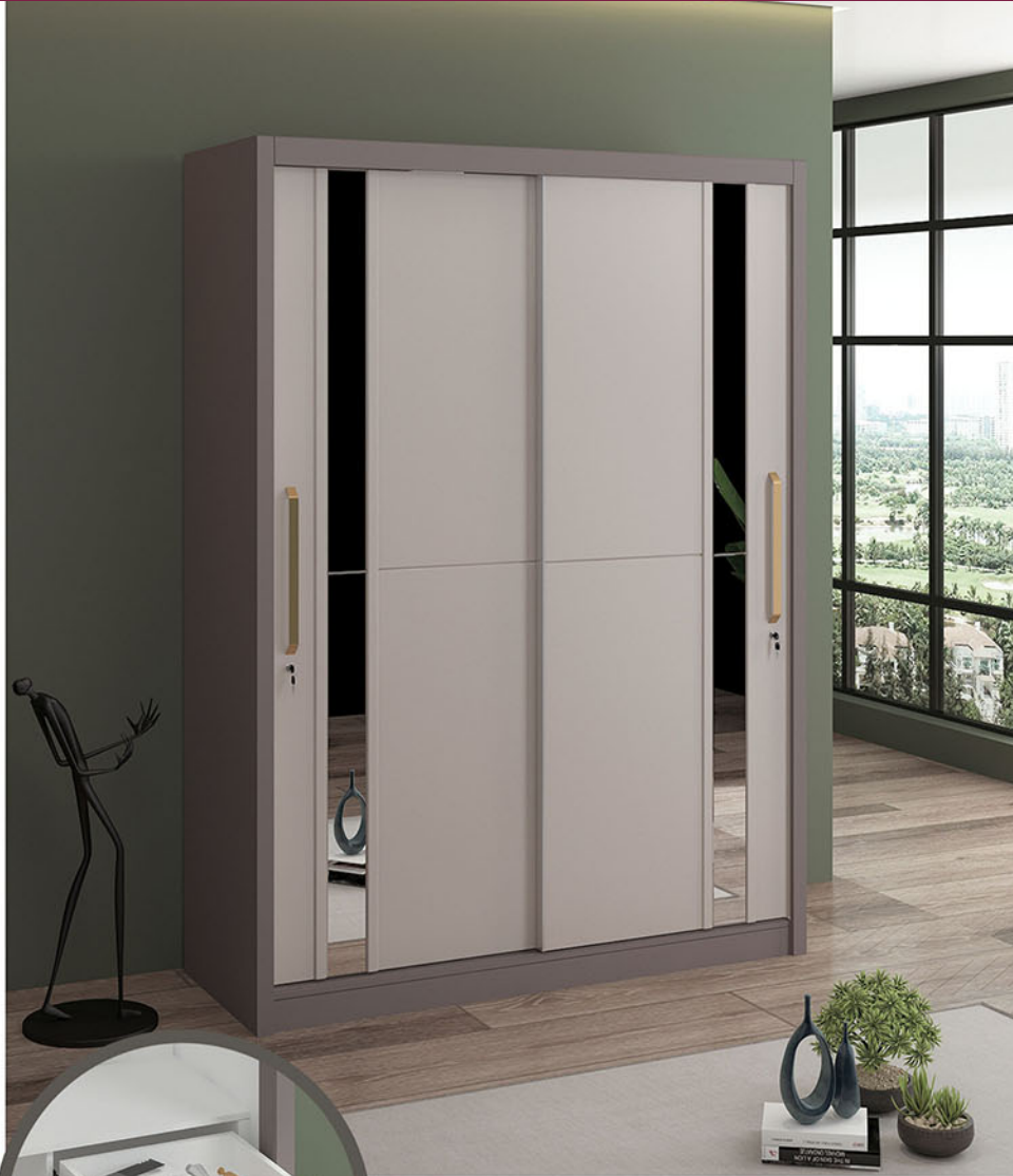
LP VOLARE 3D SL lemari pakaian Pintu sliding P.160 X L.60 X T.220

Terbuat dari particleboard dan MDF finishing PVC sheet colt beige kombinasi pastel grey dengan penambahan cermin terdapat laci tersembunyi