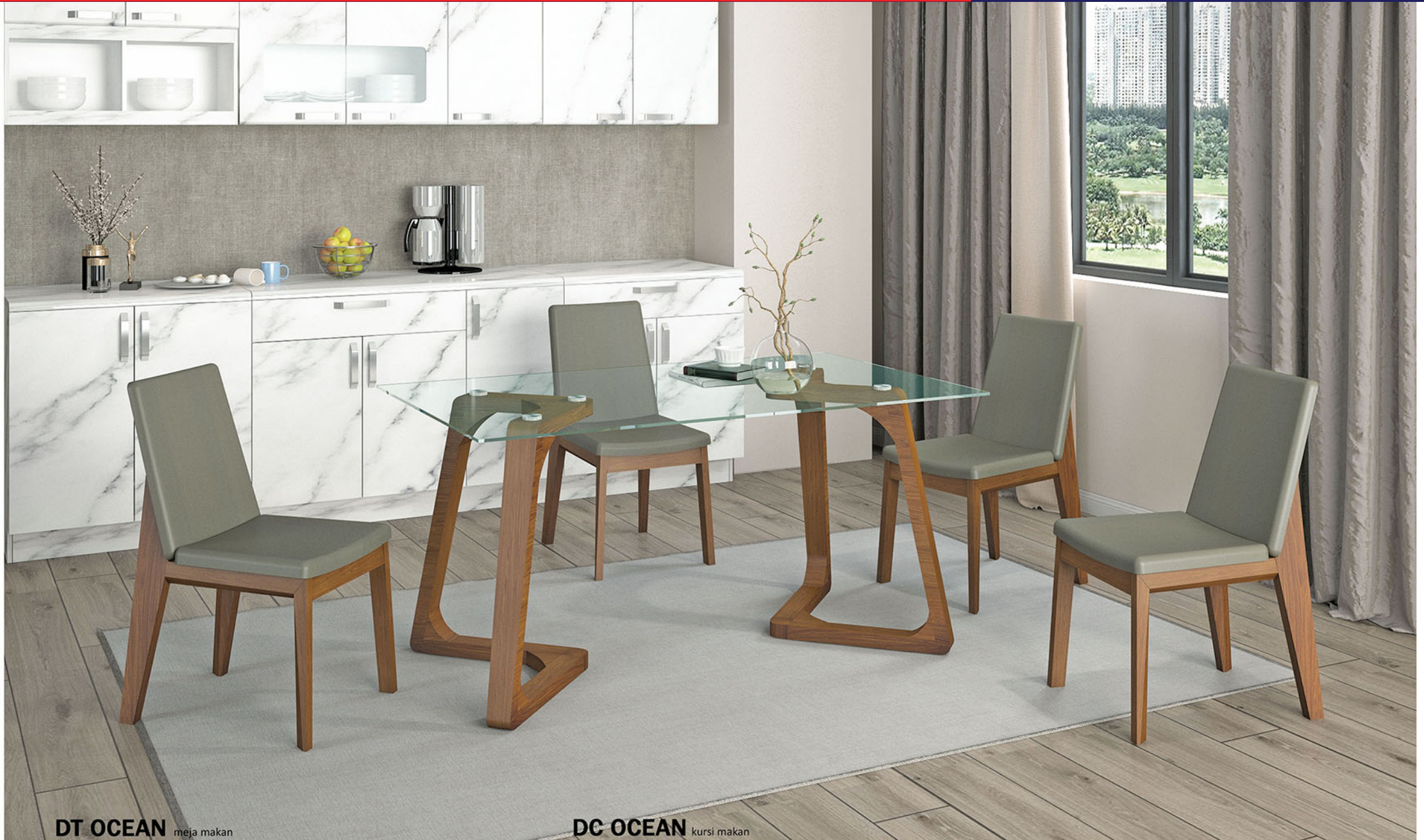
DT OCEAN meja makan

Meja terbuat dari bahan kayu solid finishing PU teak brown Top meja menggunakan kaca polos