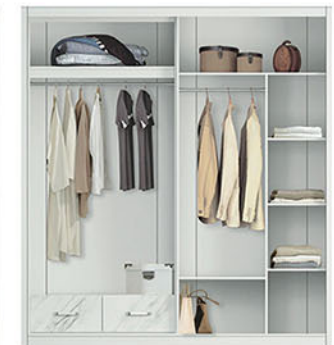
LP MARBLE 4D SS [sliding swing] W.200 X D.60 X H.220 pvc sheet marble (+ mirror)