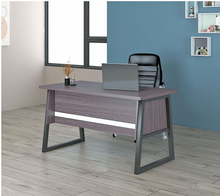
OT 122 P.120 X L.60 X T.75

Terbuat dari particleboard dan MDF finishing paper sheet grey ashtree yang dikombinasikan pvc vacum white gloss Kaki meja pipa besi kotak finishing powder coating hitam Body pedestal terdiri dari 1 laci dan 1 pintu bisa dipasang disisi kiri maupun kanan