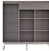
CB VOLARE 120-02 cabinet P.120 X L.40 X T.120