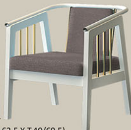
1 seater (P.58 X L.62,5 X T.40/69,5)

* warna bisa berubah karena proses cetak