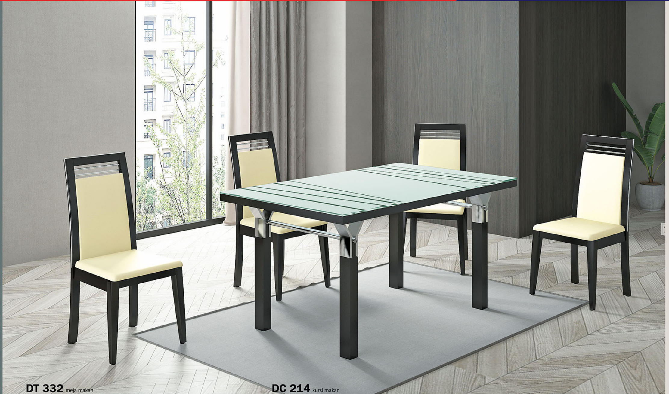
DT 332 meja makan

Meja terbuat dari bahan kayu solid finishing PU walnut Yang dikombinasikan dengan besi yang di chrome Finishing kaca meja dengan variasi sablon gambar yang dicat putih seluruh permukaannya