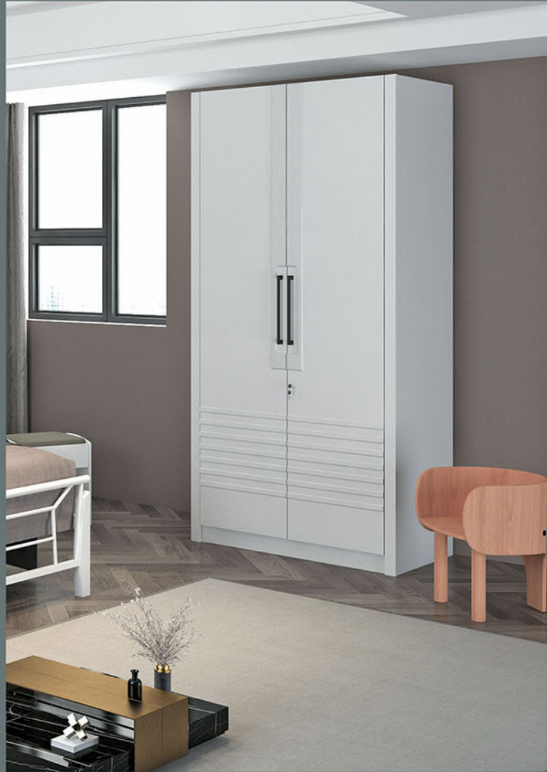
LP CAPITOL 2D SW lemari pakaian Terbuat dari particleboard dan MDF finishing pvc vacuum white gloss Pintu swing atau pintu kupu-kupu Terdapat 1 gantungan baju dan beberapa rak