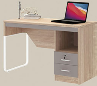
OT 155 P.120 X L.60 X T.75

Terbuat dari Particleboard dan MDF finishing pvc sheet Natural kombinasi pvc vacum Colt Beige. Variasi Kaki meja pipa besi finishing powder coating Putih. Body pedestal terdapat 2 laci