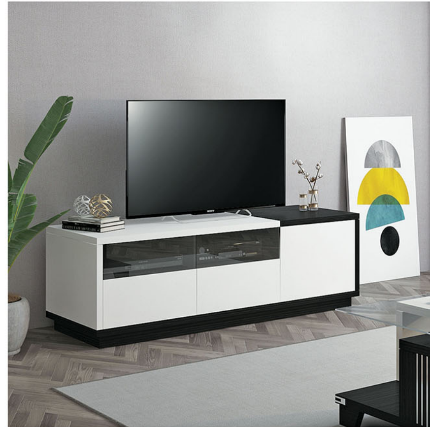
TC 004 tv cabinet P.160 X L.50 X T.50

Terbuat dari particleboard dan MDF finishing pvc sheet hitam dikombinasikan dpvc vacum white gloss Terdapat 1 pintu dan 2 laci.