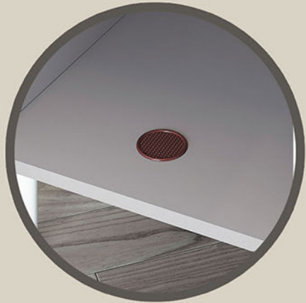
lubang sirkulasi udara

Variasi kaki pipa besi powder coating putih