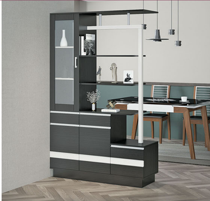
DV 001 P.120 X L.40 X T.190

Terbuat dari particleboard dan MDF finishing paper sheet walnut dan putih dikombinasikan pipa besi finishing powder coating putih dan pipa besi chrome Terdapat 4 pintu, 2 laci dan beberapa rak