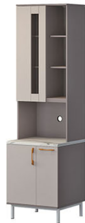
KC 02 AB-1 P.60 X L.60 X T.220

Softclose Engsel pintu & rel laci yang menutup perlahan tanpa suara benturan