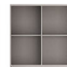
KC 02 B-2 P.80 X L.60 X T.80