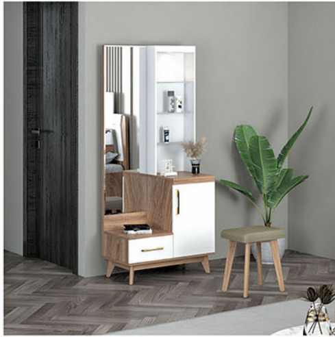
DR CARIBIA dresser Terbuat dari particleboard dan MDF finishing pvc sheet natural dengan variasi pvc sheet putih Kaki terbuat dari kayu solid finishing fancy duco Terdapat 1 laci & 1 pintu