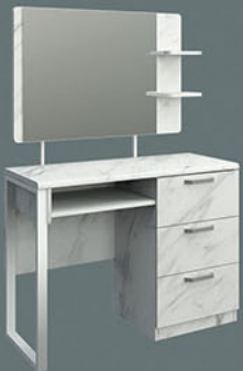
MR MARBLE 01 meja rias Terbuat dari particleboard dan MDF finishing pvc sheet marble Terdapat 3 laci Variasi kaki besi putih