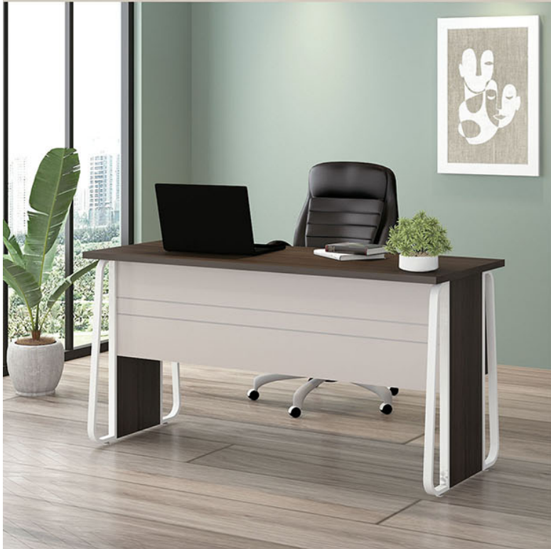
OT 157 P.150 X L.60 X T.75

Terbuat dari Particleboard dan MDF finishing pvc sheet Grasse Grey Oak kombinasi pvc Pastel Grey. Variasi Kaki meja pipa besi finishing powder coating Putih. Body pedestal di sisi kanan dan kiri, terdapat 2 laci dan 1 pintu