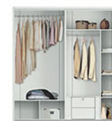
LP MARBLE 4D SL lemari pakaian Terbuat dari particleboard dan MDF finishing pvc vacuum marble. Dengan penambahan variasi cermin Pintu sliding, Handle Aluminium