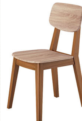
DC HONOLULU kursi makan

Kursi terbuat dari bahan kayu solid finishing PU teak brown Jok & sandaran kursi dari MDF finishing pvc sheet natural