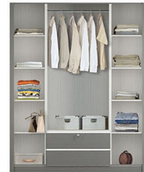
LP 389 SW [swing] W.160 X D.60 X H.200 pvc sheet abu-abu serat doff & putih serat gloss