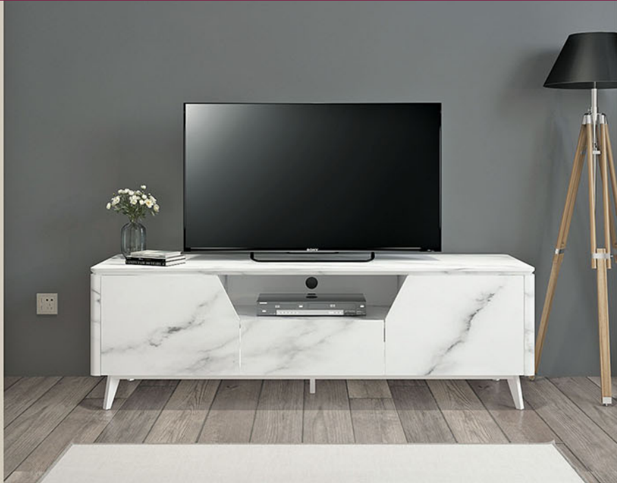
TC MARBLE 160-01 tv cabinet P.160 X L.50 X T.50

Terbuat dari particleboard dan MDF Finishing pvc vacum marble Terdapat 1 laci & 2 pintu Variasi rak terbuka Kaki terbuat dari pipa besi finishing powder coating putih