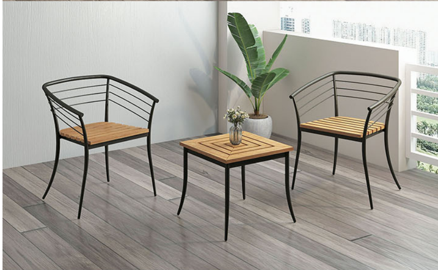
KT 005 kursi teras MT 005 meja teras P.50 X L.50 X T.45

Rangka pipa besi finishing powder coating brown matt