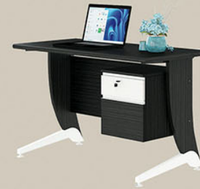
OT 121 P.120 X L.60 X T.75

Terbuat dari particleboard dan MDF finishing paper sheet walnut & putih serat Terdapat body pedestal 1 laci dan 1 pintu