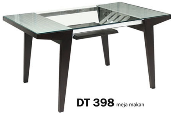
DT 398 meja makan

Meja terbuat dari kayu solid finishing PU walnut Rak meja terbuat dari MDF finishing pvc vacuum walnut Yang dikombinasikan dengan pipa besi finishing powder coating putih dan chrome Top meja menggunakan kaca polos.