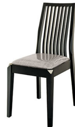
DC 256 kursi makan

Kursi terbuat dari bahan kayu solid finishing PU walnut Jok kursi dari spons dilapisi kain