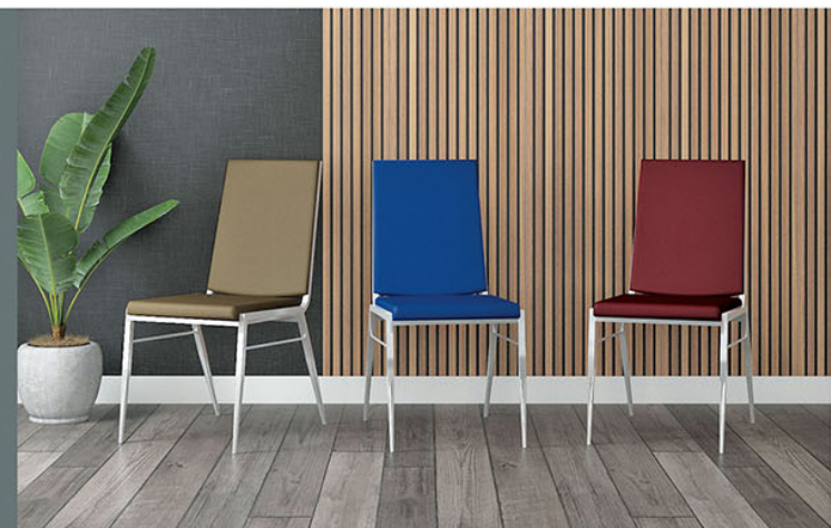
KS 002 kursi susun Rangka pipa besi finishing chrome Sandaran dan jok kursi busa rebonded dilapisi kain Terdapat 3 warna sandaran dan jok biru, merah dan coklat

Rangka pipa besi finishing chrome Sandaran dan jok kursi busa rebonded dilapisi kain Terdapat 3 warna sandaran dan jok biru, merah dan coklat