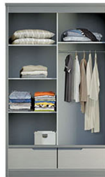
LP 289 SL [sliding] W.120 X D.60 X H.200 pvc sheet abu-abu serat doff & putih serat gloss