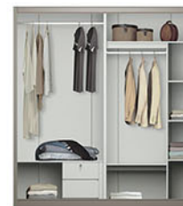
LP VOLARE 4D SW lemari pakaian Pintu swing