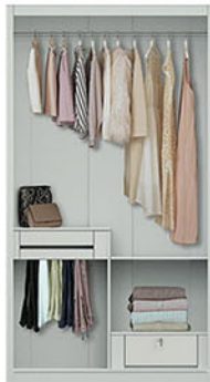
LP MARBLE 2D SL [sliding] W.120 X D.60 X H.220 pvc sheet marble (+ mirror)