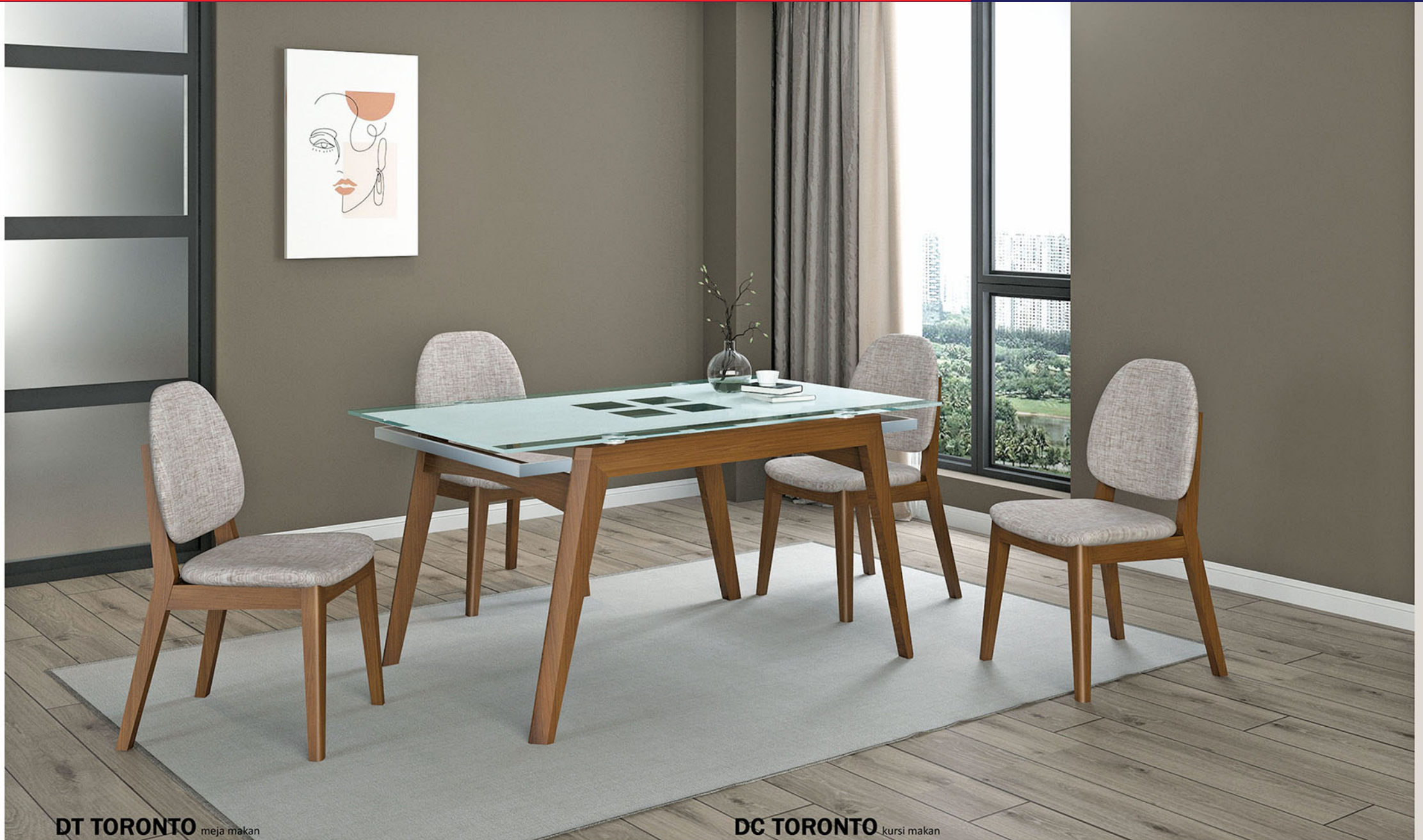
DT TORONTO meja makan

Rangka Meja terbuat dari bahan kayu solid finishing PU teak brown Dengan penambahan variasi dari besi finishing powder coating putih Finishing kaca dengan variasi sandblast