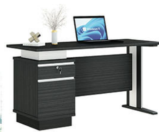
OT 120/150 P.120 X L.60 X T.75 P.150 X L.75 X T.75

Terbuat dari particleboard dan MDF finishing paper sheet walnut & putih serat Terdapat body pedestal 1 laci dan 1 pintu