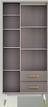
RD VOLARE 01 rak display P.80 X L.40 X T.182

MDF & Particleboard finishing PVC Sheet Colt Beige kombinasi Pastel Grey