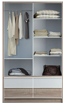
LP 288 SL [sliding] W.120 X D.60 X H.200 pvc sheet natural & white wash