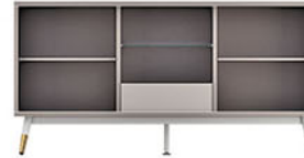
CR VOLARE 160-02 credenza P.160 X L.50 X T.80