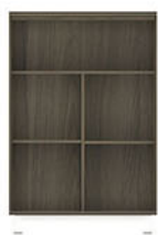
OR 009 P.80 L.40 T.120